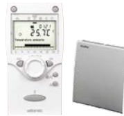
T78 (radio) réf. 074 061

Les avantages d'une commande d'ambiance modulante